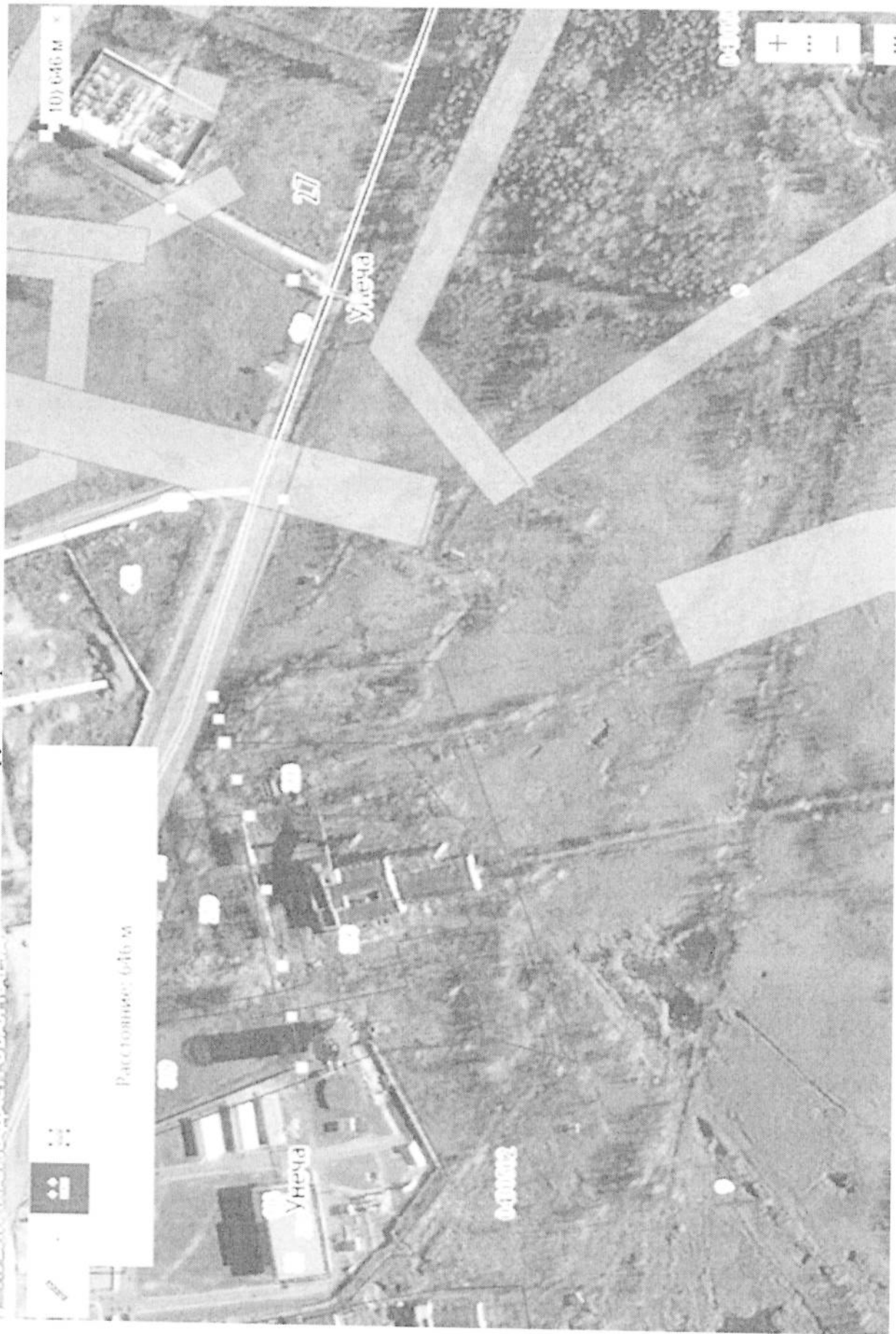
Планируемая трасса линии