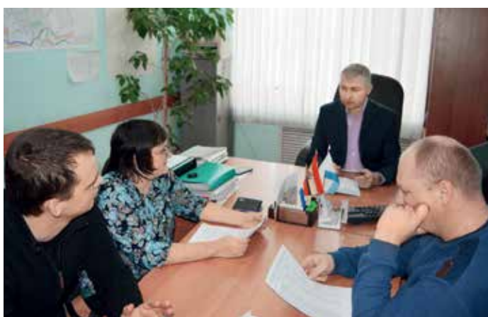
Обсуждение вопросов уличного освещения с председателями улочкомов города Фатежа

В марте состоятся выборы президента. Для меня вопрос участия или неучастия в голосовании напрямую связан с тем, как я отношусь к собственной стране. Я горжусь Россией и просто не могу оставаться равнодушным к важнейшему для нас событию».