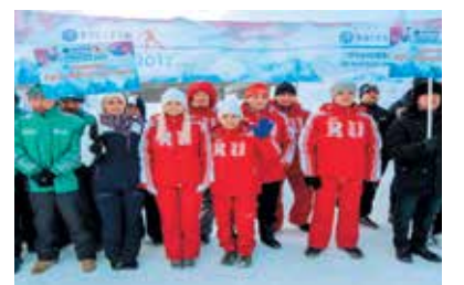
Сборная «МРСК Центра»