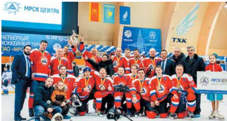
Команда «Тверьэнерго» — победители IV хоккейного турнира «МРСК Центра»

Завершили программу торжественных мероприятий выступления фигуристов и творческих коллективов Твери. 🌟